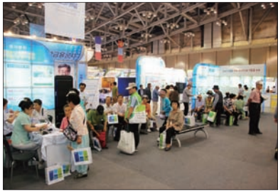
◎ 부산국제 실버엑스포 참가

6월 27일부터 29일까지 부산 벡스코에서 개최된 '부산국제 실버엑스포'에 참가하였습니다. 관람객 대상으로 무료 건강검진뿐만 아니라 양한방 건강상담, 체성분 검사, 무료건강 강좌 등을 실시하였으며, 2천명이 넘는 관람객이 본원 부스를 방문하여 성황리에 개최되었습니다.