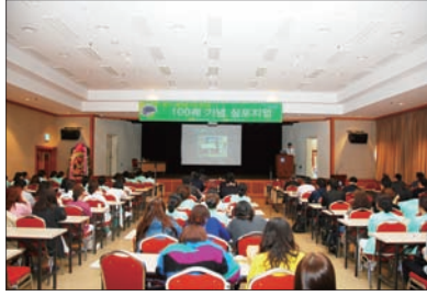
◎ 코일색전술 100례 기념 심포지엄 개최

3월 29일, 본원 7층 대강당에서 동의료원 뇌혈관센터 주최로 개최된 '코일색전술 100례 기념 심포지엄'이 성황리에 개최되었습니다. 이 심포지엄에 부산, 경남 뿐 아니라 전국 각지의 신경외과 전문의 및 간호사, 방사선사 선생님들이 참석하여 자리를 빛내주셨습니다.