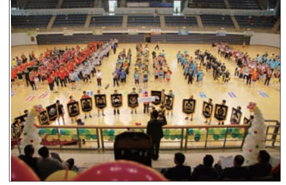
◎ 동의료원배 부산진구 배드민턴대회 개최

6월 9일, 본원이 후원한 '제 1회 동의료원배 부산진구배드민턴대회'가 부산 강서체육관에서 성황리에 마무리 되었습니다. 대회에 참석한 회원들을 대상으로 혈압, 간기능, 신장, 통풍, 고지혈증, 혈당(당뇨) 검사 등 총 16개 항목에 대해 무료 건강검진을 실시하였습니다.