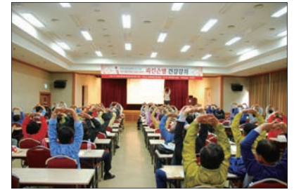
◎ 동의건강교실 개최

본원에서 개최하는 '동의건강교실'이 본원 7층 강당에서 성황리에 개최되었습니다. 매달 개최 되는 동의건강교실은 매회 200명 이상의 부산 시민들이 참여하고 있으며 평소 궁금했던 점을 질문할 수 있는 시간을 따로 마련하여 보다 정확한 건강정보를 드리기 위해 노력하고 있습니다.