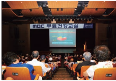
◎ MBC건강교실 개최

본원과 부산MBC문화방송이 공동으로 개최하는 'MBC건강교실'이 신세계센텀시티 문화홀에서 개최되었습니다. 3월에는 인공신장센터 오유정 소장의 '신장질환', 5월에는 이비인후과 김대희 과장의 '비염과 축농증', 7월에는 뇌혈관센터 정진영 소장의 '뇌졸중' 강연이 개최되었습니다.