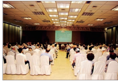
◎ 동의한방교실 개최

본원과 부산일보사가 공동으로 개최하는 '동의한방교실'이 부산일보사 10층 대강당에서 개최되었습니다. 매달 셋째 주 목요일 (1.8월 제외)에 진행되는 동의한방교실은 매 회 200명 이상의 부산시민들이 참여하여 평소 한방치료에 관해 궁금했던 질문의 시간을 가지는 등 성황리에 개최되었습니다.