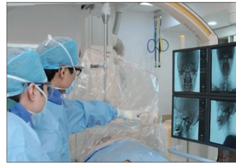
<동의학료원 뇌혈관센터 시술 장면>

동의병원 뇌혈관센터는 뇌혈관 질환 진단, 치료의 첨단장비를 갖추고 있으며 우수한 의료진이 각종 뇌혈관 질환 치료